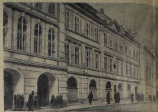
Недавно в Праге открылся музей Владимира Ильича Ленина, созданный по инициативе Центрального Комитета Коммунистической партии и правительства Чехословакии. Музей открыт в Народном доме по Гибриковой улице, где проходила историческая шестая Всероссийская конференция РСДРП.