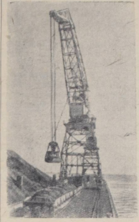
Крымская область. Камышбурский железорудный комбинат — передовое предприятие страны. Его коллектив ежемесячно дает большое количество агломерата сверх плана.

ВОРОНЕЖ. На предприятиях Воронежа развертывается социалистическое соревнование за достойную встречу Международного праздника трудящихся — 1 Мая. Инициатором соревнования выступил коллектив экскаваторного завода. Он обязался изготовить к 1 мая несколько экскаваторов сверх плана, применить 80 новых усовершенствованных приспособлений и инструментов, до 15 апреля подготовить к государственным испытаниям модернизированный экскаватор.