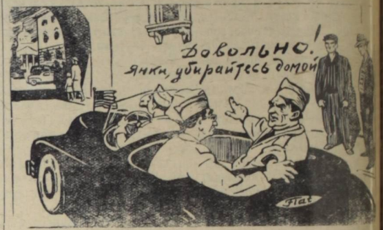
— Правительство нами довольно, а народ говорит: «Довольно!» Рис. С. Чистякова.