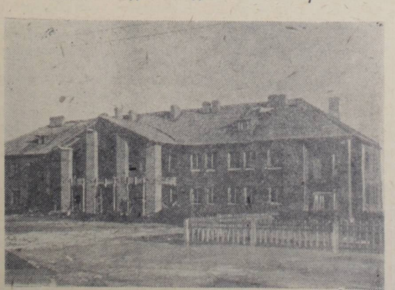
Коллектив второго участка строительного управления № 4 ведет работы по внутренней отделке новых жилых домов в поселке шахты № 1. Включившись в предмайское социалистическое соревнование, строители показывают образцы стахановской работы. Бригада плотников т. Волкова, бригады штукатуров тт. Харчикова и Смирновой выполняют сменные задания на 140—170 процентов.

На снимке: строительство здания молодежного общежития.