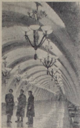
Москва. Вступила в строй новая подземная магистраль московского метрополитена — Арбатский радиус с тремя новыми станциями «Арбатской», «Смоленской» и «Киевской».

заведующая учебной частью средней школы № 2.