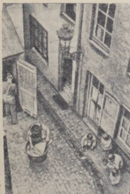
Французский журнал «Ретар» поместил этот снимок со следующей подписью: «Дождевая вода — единственная проточная вода для стирки и игр детей. Нет прачечных, умывальников. Днем в эти лагуны на несколько часов заглядывает солнце, если оно не скрыто клубами дыма. Ночью — здесь бледное газовое освещение. Так живут миллионы трудящихся Франции».

От снижения цен, проведенного в 1951 году, выгода населения составила 27,5 миллиарда рублей, в 1952 году — 23 миллиарда рублей, в 1953 году выгода составит 53 миллиарда рублей.