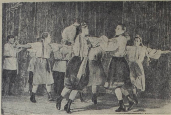
На снимке: танцевальный коллектив железнодорожного клуба станции Барабинск Омской железной дороги исполняет на заключительном концерте молдавский танец «Жок».

Свыше 200 стахановцев Московского завода «Динамо» имени С. М. Кирова встречают Первомайский праздник выполнением пятилетних норм.