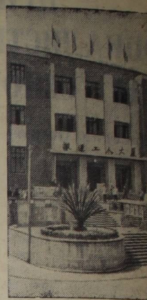
Китайская Народная Республика. В недавно построенном чунцинских транспортных имеются концертный театр, зал для танцев, читальня, помещения для занятий спортом и для отдыха.