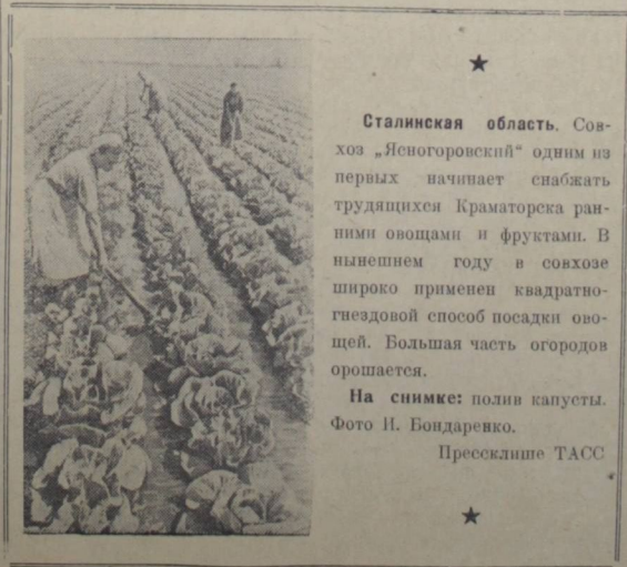
★ Сталинская область. Совхоз «Ясногородский» одним из первых начинает снабжать трудящихся Краматорска ранними овощами и фруктами. В нынешнем году в совхозе широко применен квадратно-гнездовой способ посадки овощей. Большая часть огородов орошается. На снимке: полив капусты.