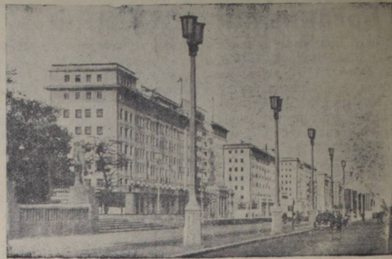
Германская Демократическая Республика. Быстрыми темпами продолжается грандиозное жилищное строительство на Аллее Сталина в демократическом секторе Берлина. В этом году на этой магистрали и в прилегающих к ней кварталах строится 8—9-этажные дома, в которых будет около полутора тысяч квартир. Сооружаются школы, магазины, различные коммунальные учреждения. На снимке: новые дома на Аллее Сталина.

Колорадский картофельный жук — довольно крупное насекомое, около одного сантиметра в длину. Тело его сильно выпуклое, блестящее, желтое с черными пятнами на голове, переднеспинке и брюшке. На каждом надкрылье имеется по пяти черных продольных полос (всего десять полос). Усики постепенно утолщаются к концу, у основания они желтые, а на конце черные. При полете видны крылья — у молодых жуков дымчатые, у старых — красноватые.