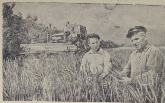
Краснодарский край. Механизаторы Кисляковской МТС Куцевского района вывели комбайны на поля колхоза имени Ленина. В этом году колхозу предстоит убрать урожай зерна с площади в 250 гектаров.

Ученые Всесоюзного научно-исследовательского института сельскохозяйственной микробиологии разработали новый препарат закваски для силосования из специальных кормовых дрожжей и молочнокислых бактерий. При внесении этой комбинированной закваски качество силоса значительно повышается. Это подтвердили опыты, проведенные научными работниками в колхозе «Коммунар», Всеволодского района и в совхозе «Красная заря» Ленинощере. Добиться положительных результатов удалось как при холодном способе силосования в сооружениях, так и при упрощенных способах в стогах.