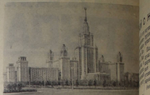
Москва. Высотное здание Московского Государственного университета на Ленинских горах. Фото Н. Грановского. Пресскапше Т.

Партийное собрание показало единодушное и сплоченное коммунистов. В единогласно принятой резолюции оно делалом и полностью одобрило постановление Пленума ЦК КПСС, приняло его к руководству и неуклонному исполнению и наметило конкретный план улучшения партийно-политической работы.