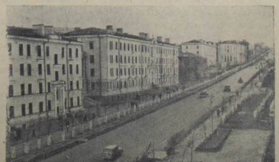
Хабаровский край. Проспект имени Ленина в Магадане.