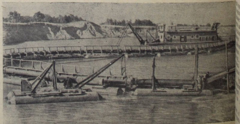
Сталинградгидрострой. Комсомольско-молодежный земснаряд 501 производит выемку грунта на дамбе на трассе нижнего подводящего канала к плесу со стороны Волги. На снимке: земснаряд 501.