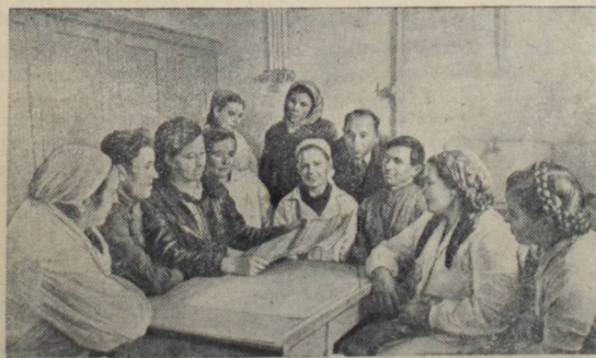
Московская область. Колхозники сельхозартели имени Владимира Ильича (Ленинский район) активно изучают постановление Пленума ЦК КПСС «О мерах дальнейшего развития сельского хозяйства СССР».

Источником общественного богатства служит труд колхозников. Доходы от рыбного промысла в этом году составят около миллиона рублей. Только премий за успешный лов получено от государства 300 тысяч рублей, из которых больше половины израсходовано на дополнительную оплату труда рыбаков. Стране дано более 1.300 центнеров рыбы сверх плана. В лове семги колхозники «Севера» опередили всех рыбаков Ненецкого национального округа.