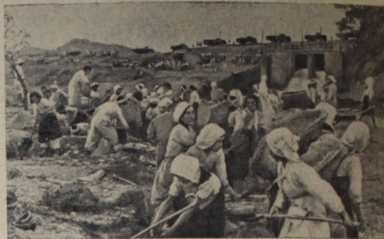
Корейская Народно-Демократическая Республика. Корейский народ, одержав победу в освободительной Отечественной войне, приступил к мирному труду. Восстанавливаются города и поселки, фабрики и заводы, водохранилища, разрушенные американскими войсками и душными пиратами.

На снимке: крестьяне восстанавливают плотину Суванского дохранилища.