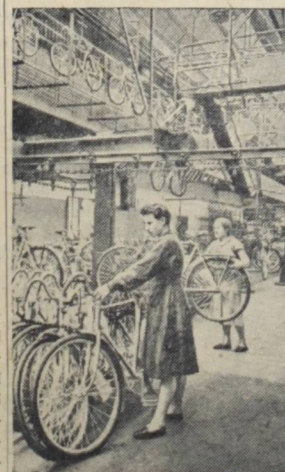
Москва. В цехе сборки велосипедов автозавода имени И. В. Сталина.