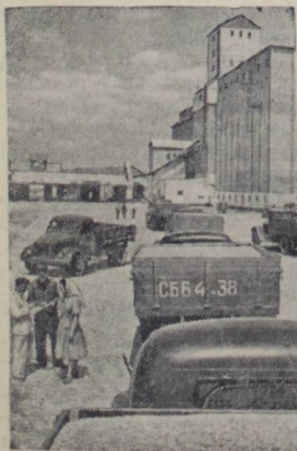
Ставропольский край. С первых дней уборки урожая непрерывным потоком зерно с колхозных токов поступает на элеваторы.

На снимке: автомашины с зерном вожат урочая на Петровском элеваторе.