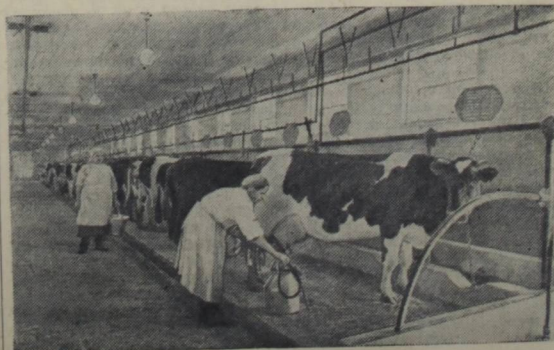
Московская область. Совхоз «Горки II» Кунцевского района — один из передовых в стране. Здесь хорошо развито животноводство и птицеводство, механизированы трудовые работы. На снимке: на одном из скотных дворов совхоза.

Коровник в деревне Черно по решению правления колхоза будет использован для содержания молодняка крупного рогатого скота старших возрастов.