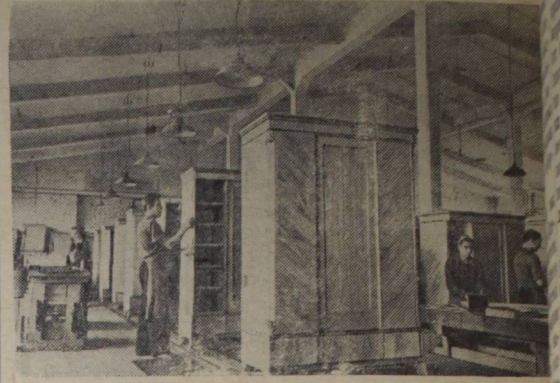
Ленинград. Коллектив мебельной фабрики № 3 ежемесячно пускает свыше двух тысяч платяных шкафов. Для их производства организован конвейер, с которого каждые 10 минут выходит готовый шкаф.