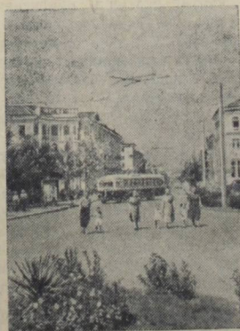
Севастополь. На площади Коммуны.

Коллектив Сызранского завода взял обязательство досрочно, к 17 декабря, завершить годовой план и дать колхозам и совхозам большое количество подвесных дорог для механизации животноводческих ферм.