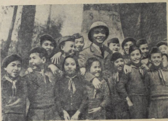
На освобожденной Народной армией от французских оккупантов территории Вьетнама создано много школ. Дети любят Народную армию, принесшую им счастливую и радостную жизнь.

Гламорганшир, Уэльс) произошел взрыв, в результате которого 10 шахтеров ранено.