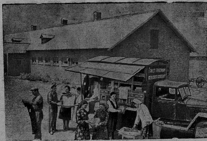
Ставропольский край. Хорошо организованное обслуживание колхозников и механизаторов Георгиевский райпотребсоюз. В колхозах района создано одиннадцать стационарных ларьков. На отдаленные участки товары доставляет передвижная лавка.

Все это показывает важную роль комиссионной торговли, способствующей дальнейшему подъему товарооборота, улучшению обслуживания трудящихся. Пора Сланцевскому райпотребсоюзу взяться по-настоящему за организацию и развертывание комиссионной торговли продуктами полеводства и животноводства.