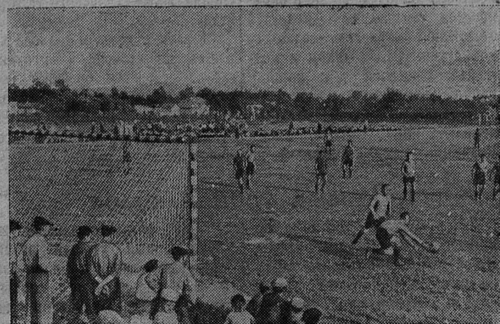
Ставропольский край. В большинстве районов края прошли товарищеские встречи колхозных футболистов добровольного спортивного общества «Колхозник». На стадионе колхоза имени Ленина Ново-Александровского района встретились футболисты колхозов имени Ленина и колхоза имени Ворошилова.