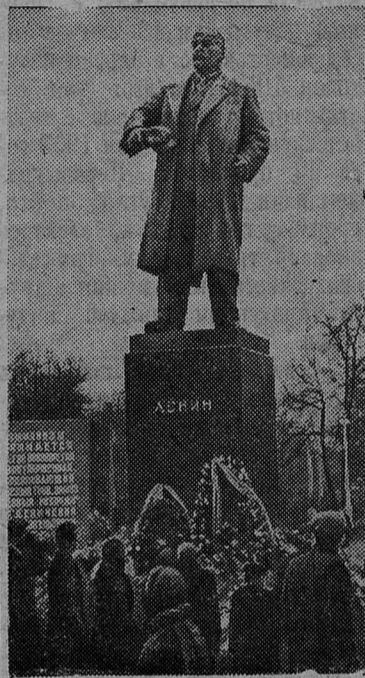
В Молотове открыт памятник основателю Коммунистической партии Советского Союза, создателю первого в мире советского социалистического государства, вождю и учителю трудящихся всего мира Владимиру Ильичу Ленину.