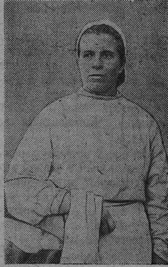
Среди животноводов сельхозартели имени Ильича широко развернулось социалистическое соревнование