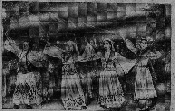
Таджикская ССР. В Сталинабаде состоялся республиканский смотр художественной самодеятельности, в котором приняло участие свыше 1.300 певцов, музыкантов, танцоров, чтецов и декламаторов. На снимке: объединенная группа участников смотра художественной самодеятельности исполняет танцевально-вокальную сюиту.