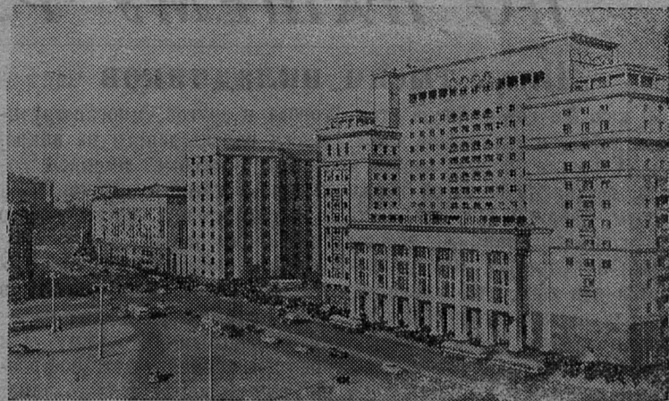
Москва сегодня. Вид на улицу Горького со стороны Кремля.

Начальник районной конторы связи т. Михайлов сообщил в редакцию, что для улучшения качества трансляции приняты меры. Сейчас ведутся работы по установке отдельной электролинии для радиоузла. В начале 1955 года в Сланцевском радиоузле будет установлена более мощная аппаратура и начнется строительство трансформаторной подстанции в поселке Большие Лучки.