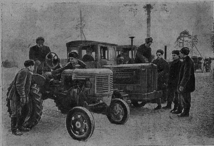
Ленинградская область. Лужское училище механизации сельского хозяйства готовит механизаторов широкого профиля. К весеннему севу училище подготовит более двухсот трактористов.

На снимке: курсанты на практических занятиях по управлению трактором.