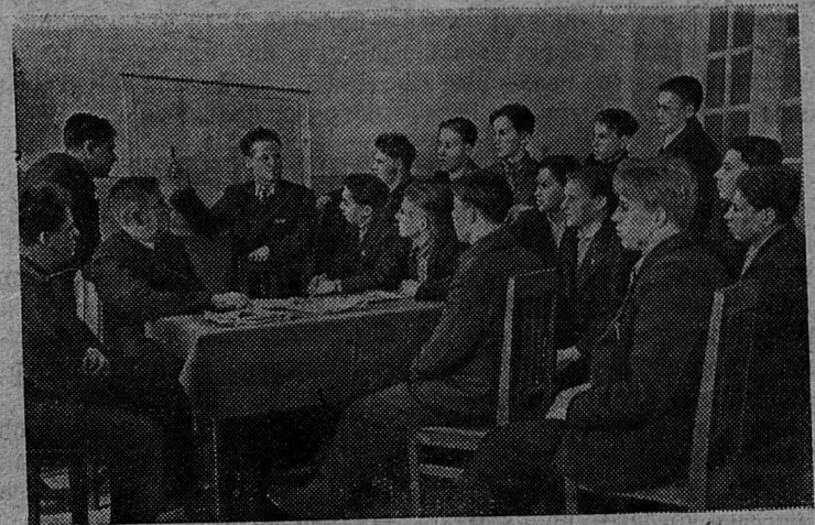
Барнаул. Первая группа московских комсомольцев, прибывших в Алтайский край на освоение целинных и залежных земель, приступила к учебе.