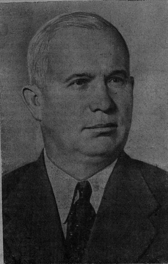
Никита Сергеевич ХРУЩЕВ

Образцы труда на колхозных полях показывает тракторист Карл Сибуль. В сельхозартели колхоза «Обновленная земля» он расчистил от кустарника 6 гектаров полей, а в артели «Май» — 8 гектаров.