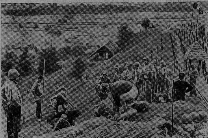
В Индо-Китае продолжается война. Соединенные Штаты Америки финансируют французских колонизаторов, увеличивают отправку им американского оружия.

Американский буржуазный журнал „Сатердей ивнинг пост“ поместил эту фотографию, изображающую французских солдат около окопов.