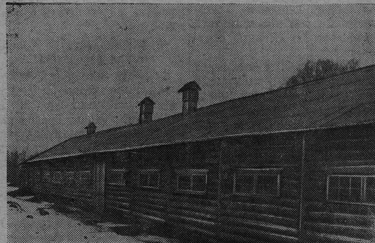
На снимке: Новый свиноводник колхоза имени Ленина.

Исполнительный комитет Сланцевского районного Совета депутатов трудящихся.