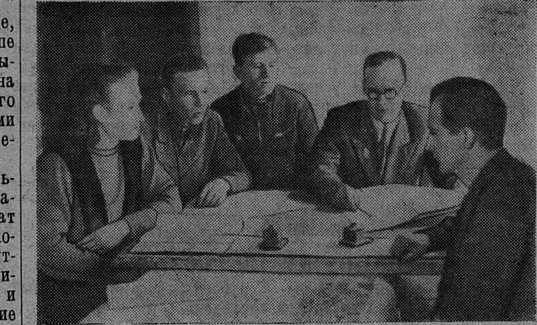
С чувством глубокого удовлетворения встретили колхозники сельхозартель имени Ленина постановление февральско-мартовского Пленума ЦК КПСС.

Хороша природа в любую пору. Но нет лучше ее в мае, когда земля дышит теплом, когда все вокруг оживает и обновляется.