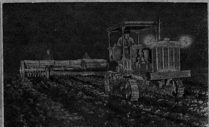
Приморский край. Механизаторы Хорольской МТС, для сокращения сроков посевных работ, проводили сев зерновых культур и в ночное время.

Мускул свой, дыхание и тело тренируй с пользой для дела!