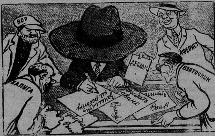
Жулье к Советскому рублю Протягивает лапу...