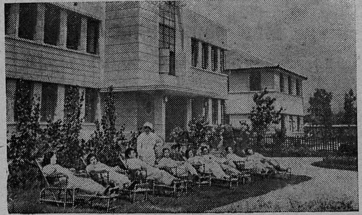
Профсоюзы Китайской Народной Республики проявляют большую заботу о здоровье и отдыхе трудящихся. На снимке: в санатории профсоюза почтово-телеграфных работников.