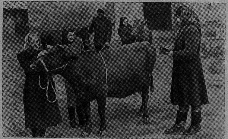
Латвийская ССР. Из года в год укрепляется хозяйство сельхозартели «Центриба» Гулбенского района. Выполняя решения сентябрьского Пленума ЦК КПСС, колхоз в этом году помог 14 семьям членов артели приобрести коров и телят для личного пользования. На снимке: осмотр коров, проданных колхозникам в личное пользование.

доцент Ленинградского института прикладной зоологии и фитопатологии.