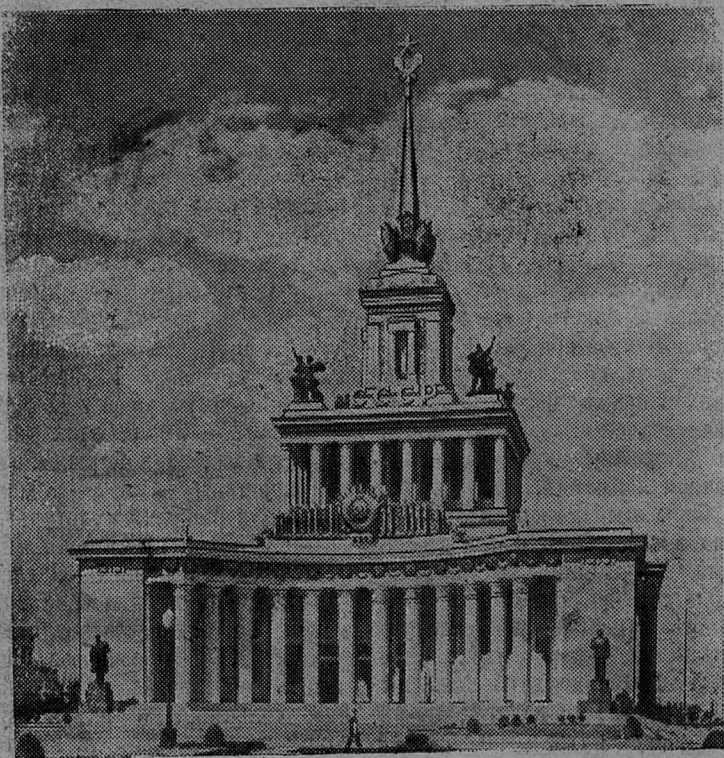
Москва. Всесоюзная сельскохозяйственная выставка. Главный павильон (вид со стороны главного входа).

Труженики полей решили перевыполнять задания на протяжении всей хлебоуборочной кампании.