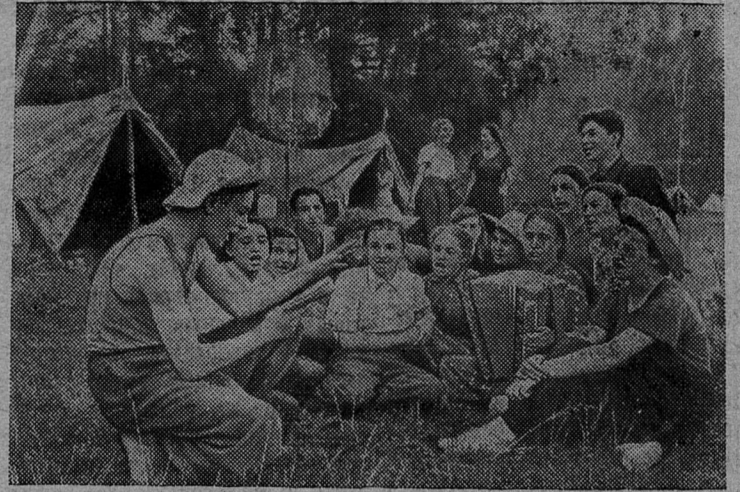
Московская область. На берегу канала имени Москвы в «Хвойном бору» проведен традиционный слет юных туристов столицы.

На снимке: в лагере юных туристов Тимирязевского района.