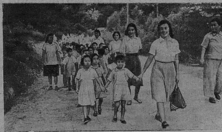
Китайская Народная Республика. На летнее время воспитанники многих городских детских садов выезжают на морское побережье.

На снимке: воспитанники тяньцзиньского детского сада на морском курорте Бэйдайхэ.