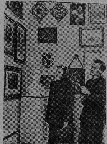
Полтава. В Полтавском художественном музее открылась областная выставка народного творчества 1954 года. На выставке представлены работы по живописи, керамике, резьбе по дереву, художественной вышивке.

Смотры проводятся: местные — на предприятиях, в учреждениях и учебных заведениях; районные и городские (в горо-