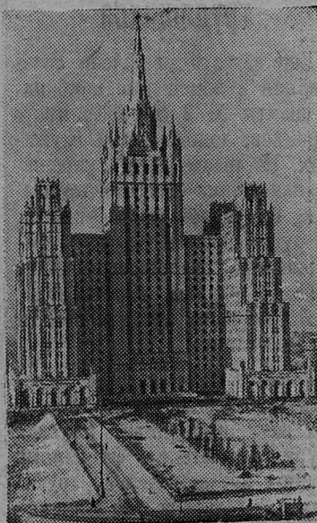
Москва сегодня. Высотное здание на площади Восстания.

бригады также работают и в декабре. Особенно хороших показателей они достигли в ночь на 12 декабря. При норме 90 вагонов отличники производства выдали на-гора 153 вагона сланца.