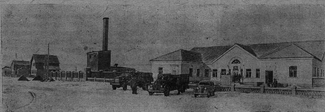
Московская область. На территории Ленинской машинно-тракторной станции Ленинского района в нынешнем году построены типовая мастерская, котельная, автогараж, два гаража для тракторов, общежития для работников МТС, здание конторы. Заканчивается строительство нефтебазы.

М. Поляков, старший инспектор Ленинградского отделения коммунального банка.