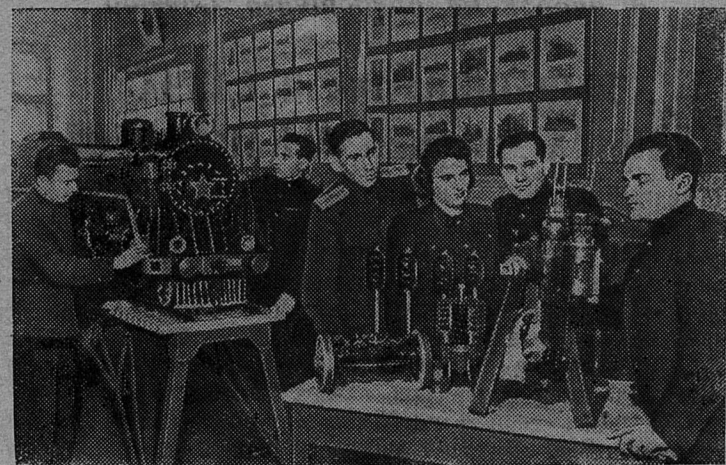
Ленинград. Дом техники имени И. В. Сталина Октябрьской железной дороги пропагандирует передовые методы труда на железнодорожном транспорте.

На снимке: учащиеся дорожной технической школы знакомятся с экспонатами в паровозном кабинете.