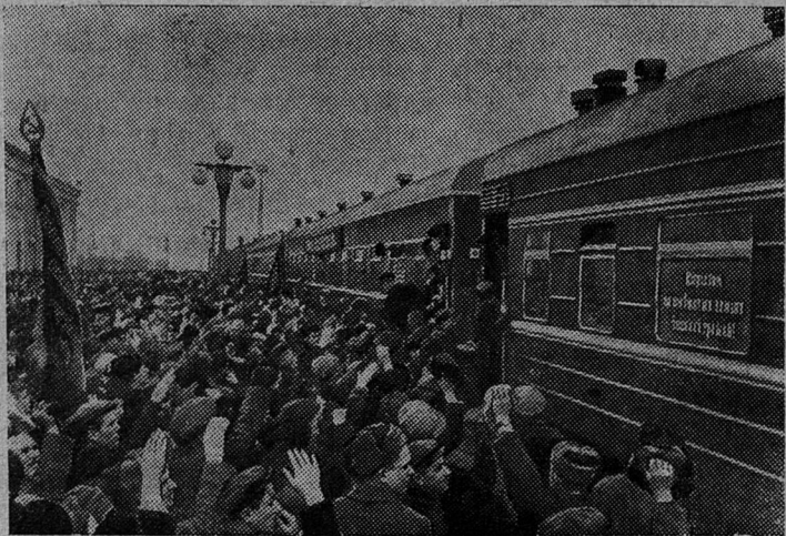
Из Минска в Казахстан выехала большая группа комсомольцев, выразивших желание работать на освоении целинных и залежных земель.

Центральный Комитет Коммунистической партии Советского Союза