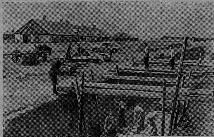
Алтайский край. В колхозе имени Сталина Егорьевского района строятся цементированные сплошные траншеи.

секретарь партийной организации погрузочно-транспортного управления треста «Ленинградсланец».