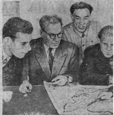
На Северо-Востоке Китайской Народной Республики Хэйлунцзян создается крупное государственное хозяйство. Госхоз будет иметь 27.000 гектар удобной для механизированной обработки, выращивать яровую пшеницу, соевые бобы, рис. На территории, отведенной хозяйству, отбита для крупного рогатого скота. В райхоза большое участие принимают советские специалисты.

За последние дни парк Рудненской МТС пополнился новой техникой. Получены два трактора-корчевателя «С-80» и два трактора «Беларусь», бульдозер, картофелекомбайн «ККР-2», канавокопатель и пять картофеле-сажалок «СКГ-4».