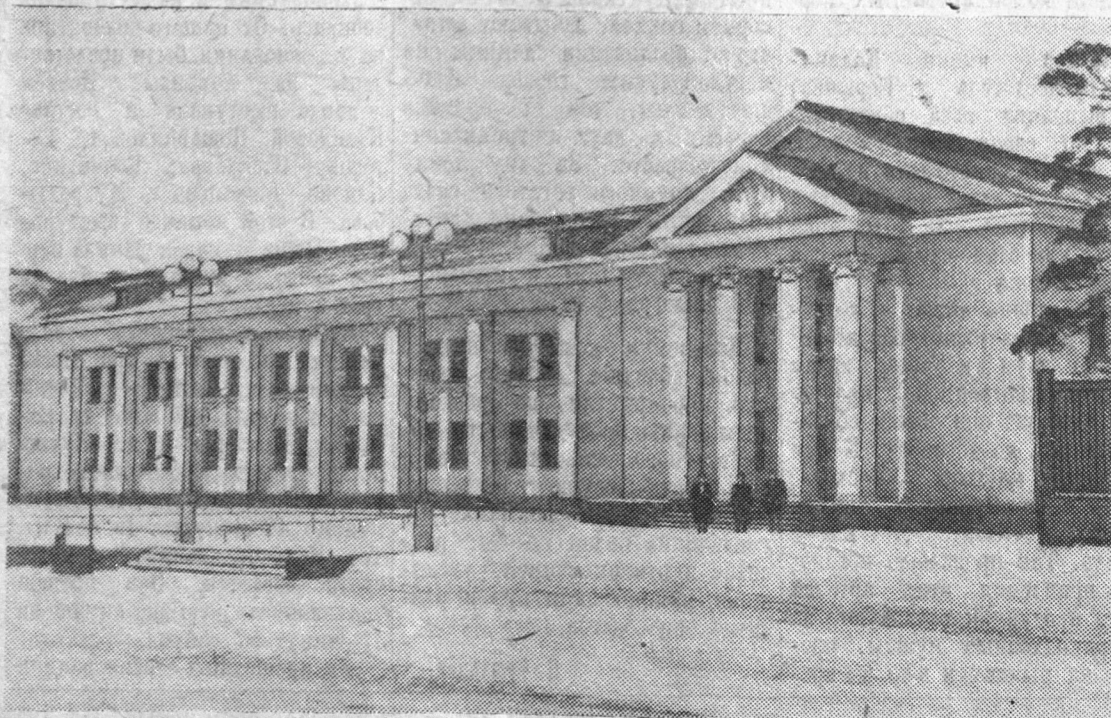
На снимке: новое здание производственного комбината шахты имени С. М. Кирова.