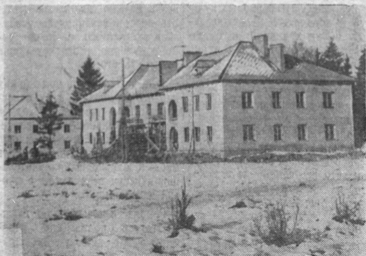
Быстро расширяются границы города Сланцы. Лес уступает место новым жилым кварталам, широким улицам и площадям. Сейчас в городе в стадии строительства находятся более 10 многоквартирных домов, предназначенных для шахтеров и строителей. На снимке: сооружение 12-квартирных домов по улице Сталина в поселке Большие Лучки.

секретарь партийной организации совхоза «Родина».