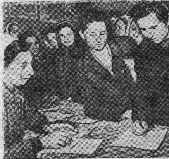
Обращение Бюро Всемирного Совета Мира против подготовки атомной войны встретил поддержку населения Румынской Народной Республики. В стране развернулся сбор подписей под Обращением. На снимке: сбор подписей на бухарестской фабрике имени Георгиу Деж.