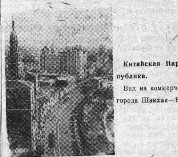
Китайская Народная Республика.