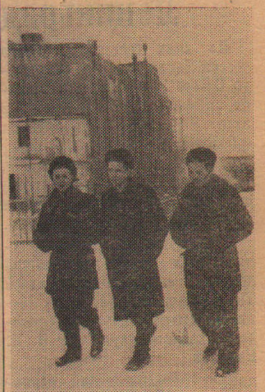
На предприятия нашего города за последние время пришло немало молодежи, окончившей среднюю школу.