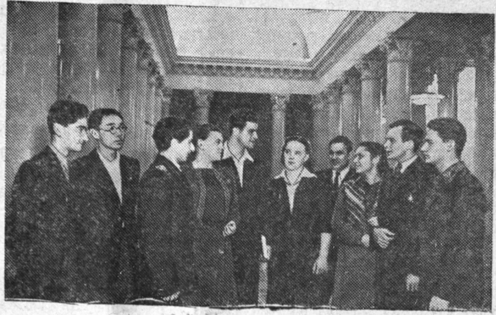
Двери Московского университета широко открыты для советской молодежи. На его 12 факультетах учится около 22 тысяч человек, среди них юноши и девушки 57 национальностей.

Московскому государственному университету имени М. В. Ломоносова—200 лет