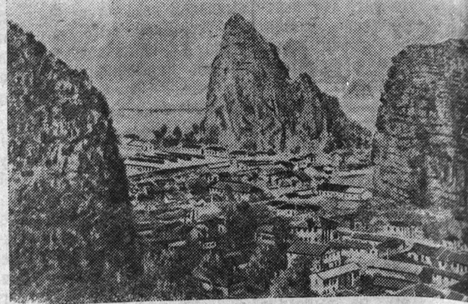
Китайская Народная Республика. Город Гуяньинь (про Гуанси).