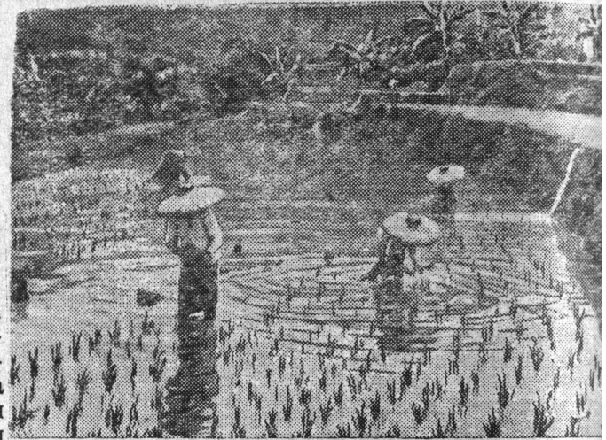
На снимке: посадка рассады риса.

Основной питания индонезийцев является рис. В некоторых частях страны снимается три урожая в год. Однако своего риса Индонезии не хватает, и ей приходится ввозить его из-за границы. Это объясняется тем, что колонизаторы умышленно поощряли производство тех сельскохозяйственных культур, которые