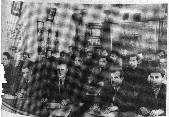
Украинская ССР. Тысячи патриотов откликнулись на призыв партии поехать в колхозы на постоянную работу. Для изъявивших желание работать в колхозах по областям республики организуются специальные курсы. На снимке: будущие руководящие работники колхозов Николаевской области на занятиях.