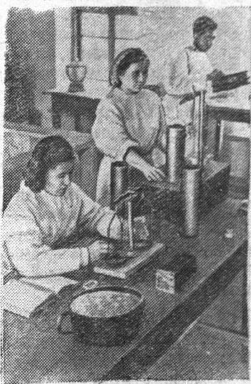
Азербайджанская ССР. В Астрахан-Базарском районе идет уборка хлебов. Первое зерно нового урожая уже поступает в государственные закрома.

вождали: Первый Заместитель Министра Иностранных Дел СССР В. В. Кузнецов, Чрезвычайный и Полномочный Посол Республики Индии в СССР К. П. Ш. Менон и дипломатический состав Посольства, Заведующий Протокольным отделом Министерства Иностранных Дел СССР Ф. Ф. Молочков. (ТАСС)