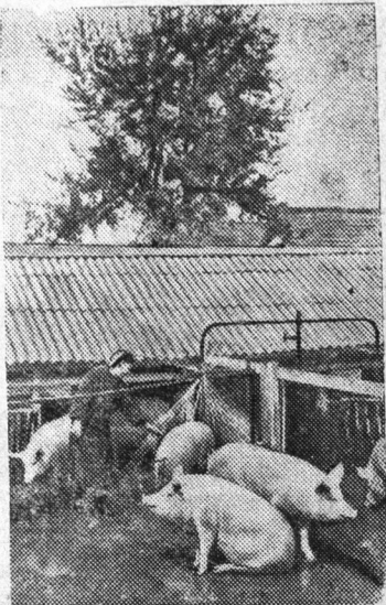
автопоилками и душевыми установками. Свинарник, кор-

Ставропольский край. Серьезных успехов в развитии и повышении продуктивности свиноводства добился колхоз имени Сталина Ново-Александровского района. Годовой доход от этой отрасли составляет около двух миллионов рублей. Это достигнуто в результате создания прочной кормовой базы, организации правильного содержания и откорма свиней. Колхоз выстроил специальный свинооткормочный лагерь для содержания и откорма полутора тысяч голов свиней зимой и двух тысяч двухсот летом. Откормочный лагерь представляет собой свинарник открытого типа, имеющий крышу и одну стену с окнами. Другая сторона открыта на цементированную выгульно-кормовую площадку. Лагерь оборудован